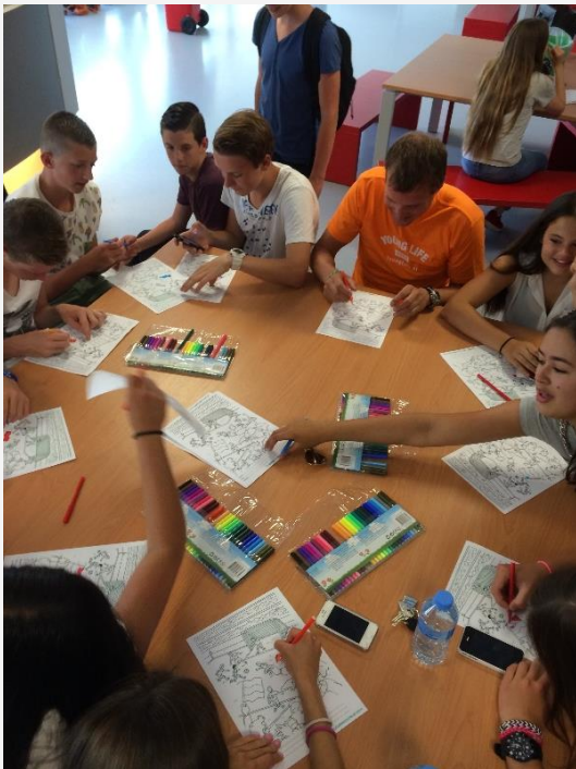
De kleurplaatwedstrijd die tijdens het WK voetbal op het Insula college door het vernieuwde team van Young Life werd georganiseerd was een doorslaand succes.

Young Life Nederland is volop in beweging. Toegegeven; naar buiten toe hebben we ons op de vlakte gehouden, maar dat betekent geenszins dat we stil hebben gezeten. Een (korte) update per plaats. Hou wat dat aangaat trouwens ook onze website in de gaten, want het is de bedoeling dat we binnenkort per plaats een aparte stadspagina lanceren met nieuws over de lokale activiteiten.